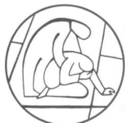
Boldogok az irgalmasok. Mt 5,7

„ B oldogok az irgalmasok, mert irgalmasságot nyernek” (Máté 5,7) Jézus nem ígér mást az irgalmat gyakorlók-nak, mint azt, amit már eddig is éltek-irgalmasságot.